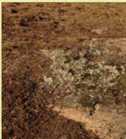
Association de lichens terricoles endommagée par le bétail. A proximité de l'affleurement rocheux, la croûte superficielle a été détruite par le piétinement.